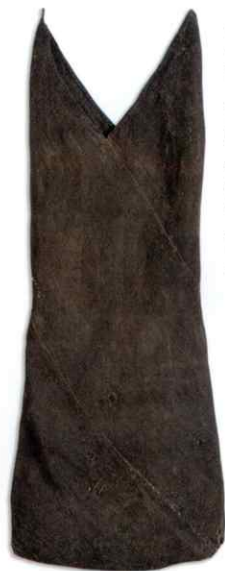
◀ 角袋 / 大麻 柿渋染 / 日本

In Japan, local bast-fibers such as taima (hemp), choma (ramie), shina (linden), fuji (wisteria), bashô (banana fiber) and kudzu (Japanese arrowroot) had been widely used before cotton became common to everyday clothing. We can feel the strength of bast-fiber textiles, emanating from the beauty of materials and the patterns produced by those materials. We hope that this exhibition will be the opportunity to rethink the profound relationship between human beings and nature, a relationship that has become more and more tenuous in our contemporary world.