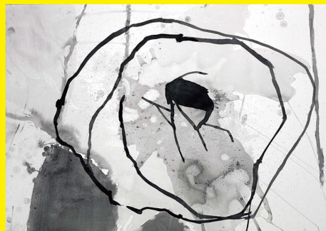
フランシスコ・ランジヨ ピースミュージアム個展 2019