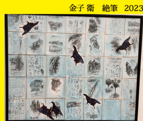
金子 衛 絶筆 2023